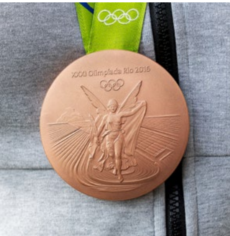
Oben: Die Bronzemedaille von Rio 2016.