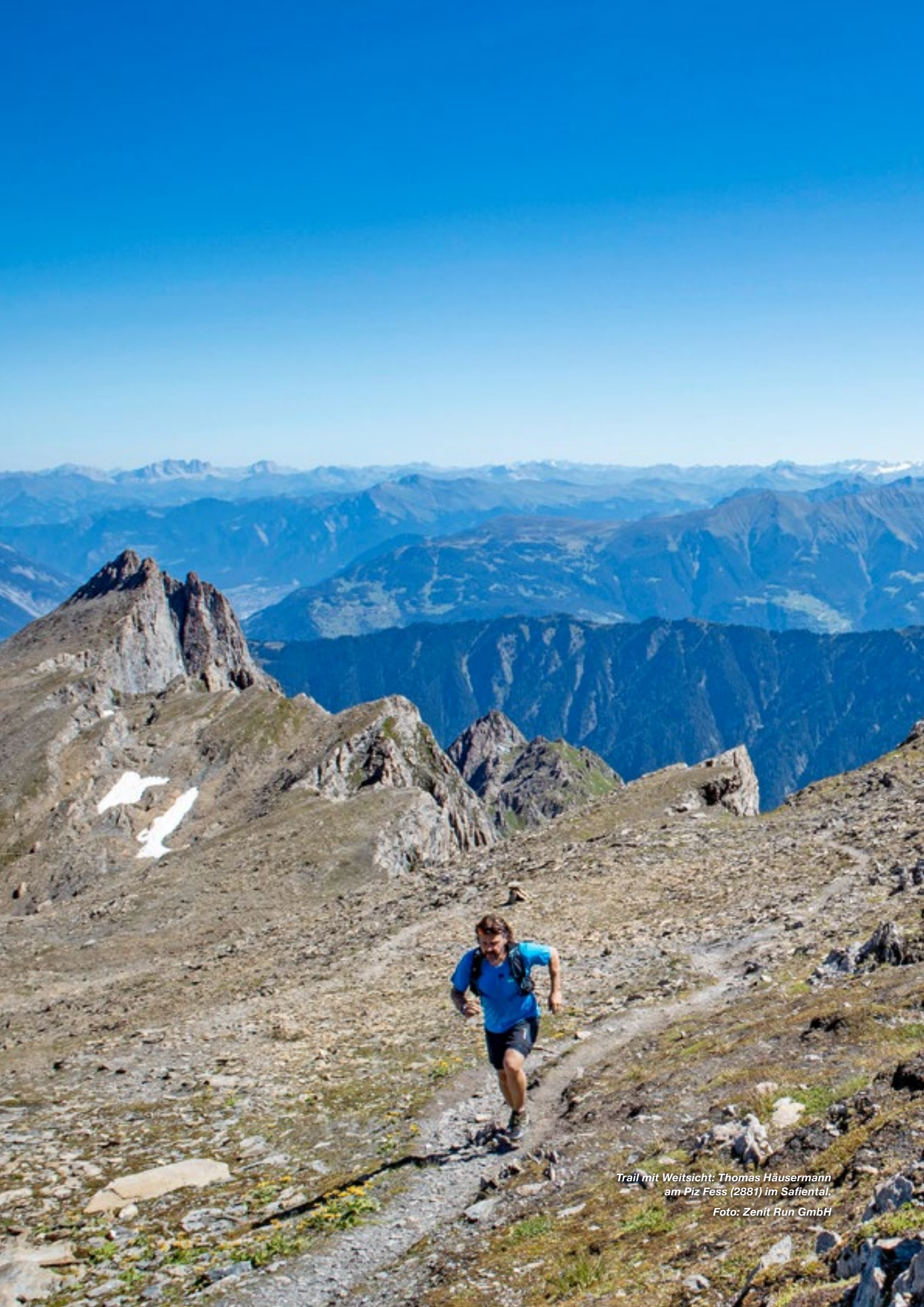
Trail mit Weitsicht: Thomas Häusermann am Piz Fess (2881) im Safental.