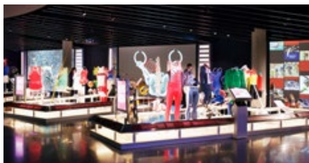
Ausgestellt sind rund 1500 Objekte.