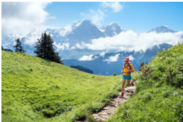
Nichts für Einsteiger: Der Trail auf die Schynige Platte und aufs Faulhorn ist 38 Kilometer lang und beträgt 2340 Höhenmeter.