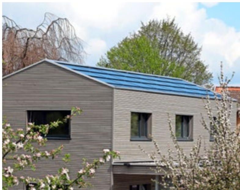
Ideal für Neubauten: eine Indach-Photovoltaikanlage.

Er ist sekundär. Vor vier oder fünf Jahren war noch Überzeugungsarbeit nötig, wenn ein Bauherr vor der Frage stand «Photovoltaik ja oder nein?». Heute geht es nur noch darum, wer den Auftrag ausführt. Im Übrigen ist eine Anlage ja nach 10 bis 15 Jahren amortisiert - und die Sonne schickt keine Stromrechnung!