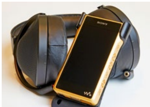
Den Walkman gibt es auch vergoldet.