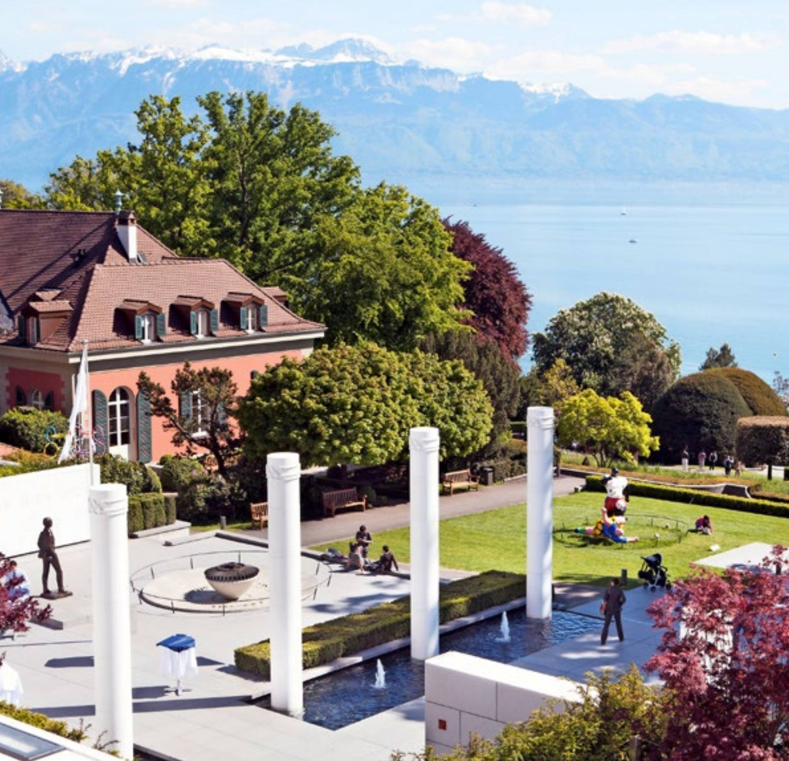
Das Olympische Museum in Lausanne ist in einem Park am Genfersee gelegen.