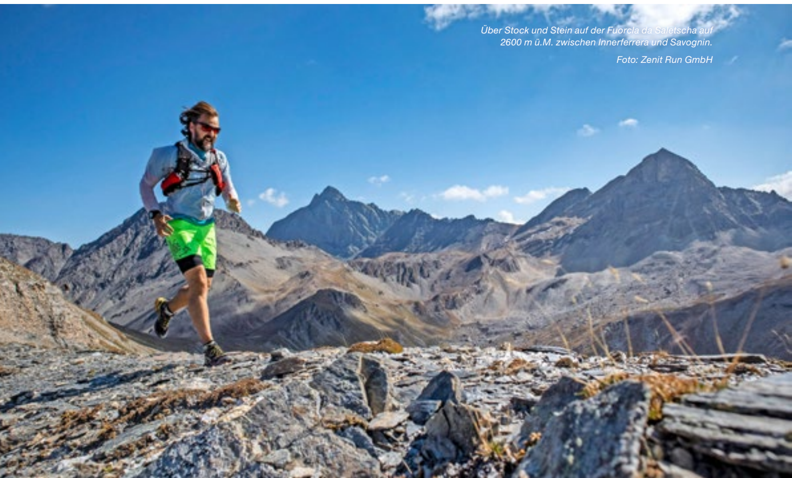
Über Stock und Stein auf der Fuorcla da Saletscha auf 2600 m ü.M. zwischen Innerferrera und Savognin.

Tatsache ist, dass es immer mehr Menschen in die Bergwelt lockt. Für sie ist die Natur ein Sehnsuchtsort. Dies bestätigt eine im letzten Jahr veröffentlichte Studie, die Michael Herrmann von SOTOMO für Schweiz Tourismus durchführte. Sie verdeutlicht, wie stark die Schweizerinnen und Schweizer die Natur als Ort der Regenerierung zum Stressabbau aufsuchen – mehr noch als das eigene Zuhause. «Auch Trail Running hat eine stressreduzierende, therapeutische Wirkung auf uns Menschen», betont Martin Nydegger, Direktor von Schweiz Tourismus.