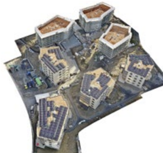
Der Menzi-Park in Widnau in 3D.