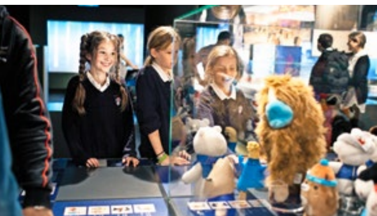
Das Olympische Museum ist speziell auch auf den Besuch von Schulklassen ausgerichtet.

Zahlreiche pädagogische Mittel sind auch online verfügbar, auf Französisch, Englisch und Deutsch. Sie können den Bedürfnissen entsprechend auch in andere Sprachen übersetzt werden. «Je nach Umfeld und Umgebung ist es auch möglich, dieses pädagogische Material anzupassen. Dazu zählt zum Beispiel der Inhalt einer Ausstellung zu den olympischen Werten, die sich an ein jüngeres Publikum richtete und vor ein paar Jahren im Museum stattgefunden hat. Das nationale olympische Komitee von Guatemala hat sich etwas einfallen lassen und zu diesem Thema eine App kreiert.»