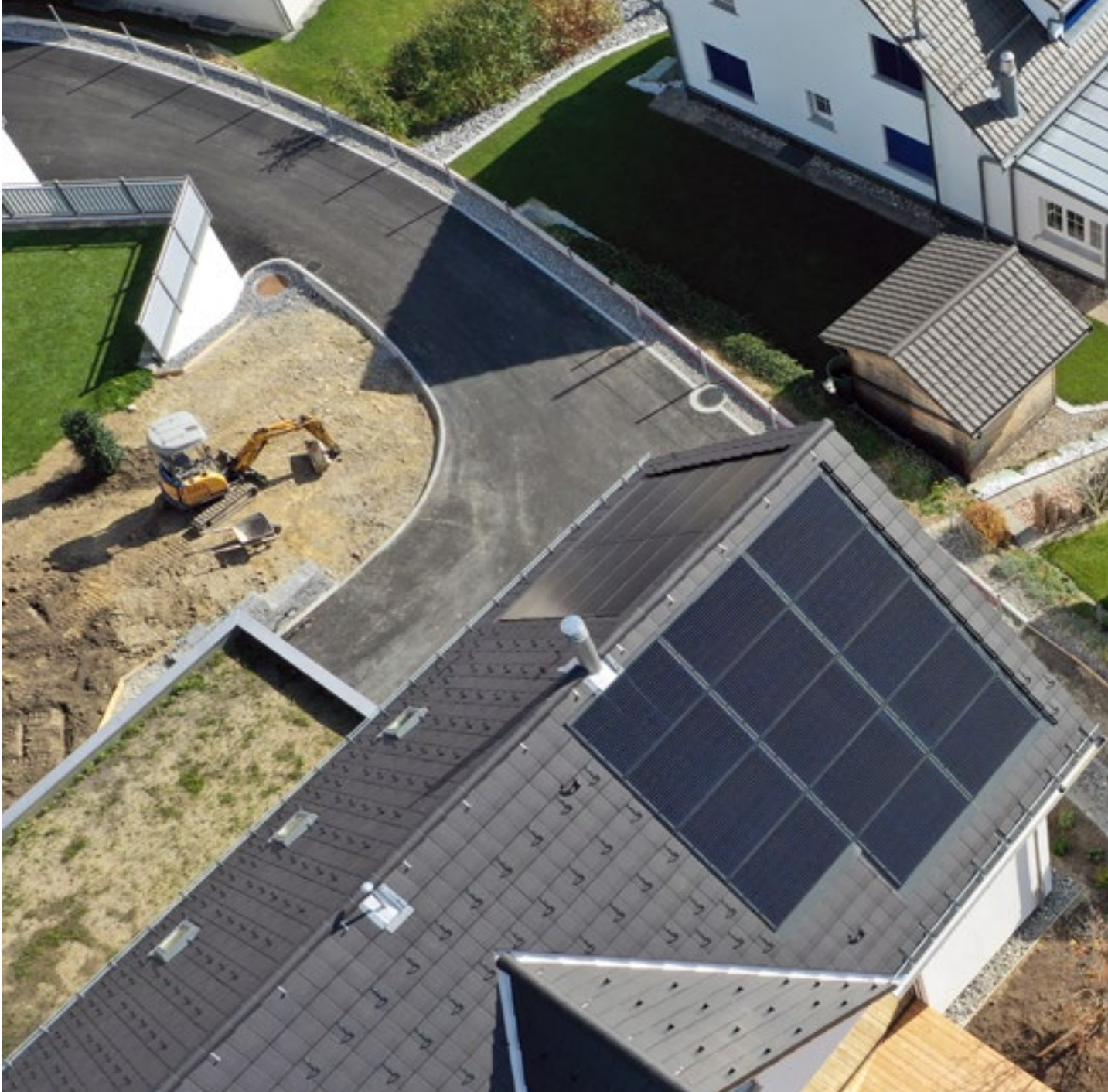
Ein Beispiel für eine Indach- (links) und eine Aufdach-Anlage (rechts).