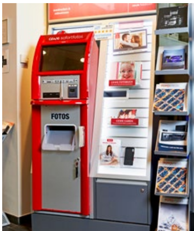
Hier kann man Fotos selber ausdrucken.