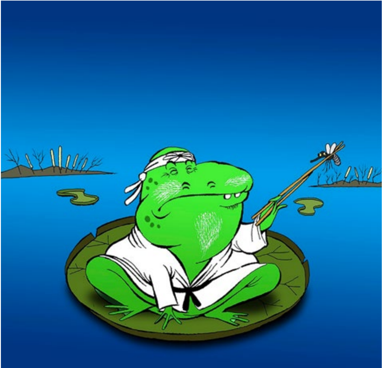
Illustration: Berk Olgun/toonpool.com