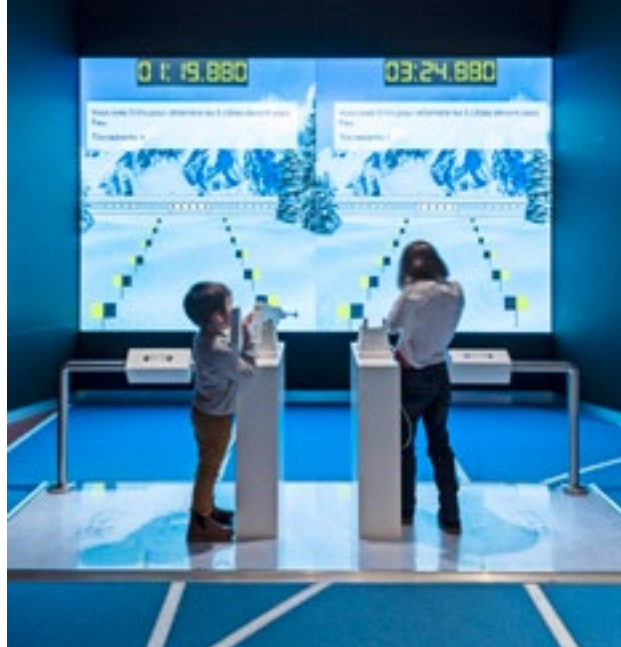
Gilt auch im Museum: Mitmachen ist wichtiger als gewinnen.

Dieses Vorgehen erlaubt auch kulturellen Austausch. «Vor den Olympischen Winterspielen in Turin 2006 waren Schulklassen aus Italien nach Lausanne zu Besuch gekommen. 2008 hatte ein Programm Schülern aus Beijing die Möglichkeit geboten, persönliche Arbeiten zu verfassen, in denen die Kinder eine Besonderheit ihrer Stadt vor den Olympischen Spielen vorstellten.» All dies unter der Federführung des Museums.