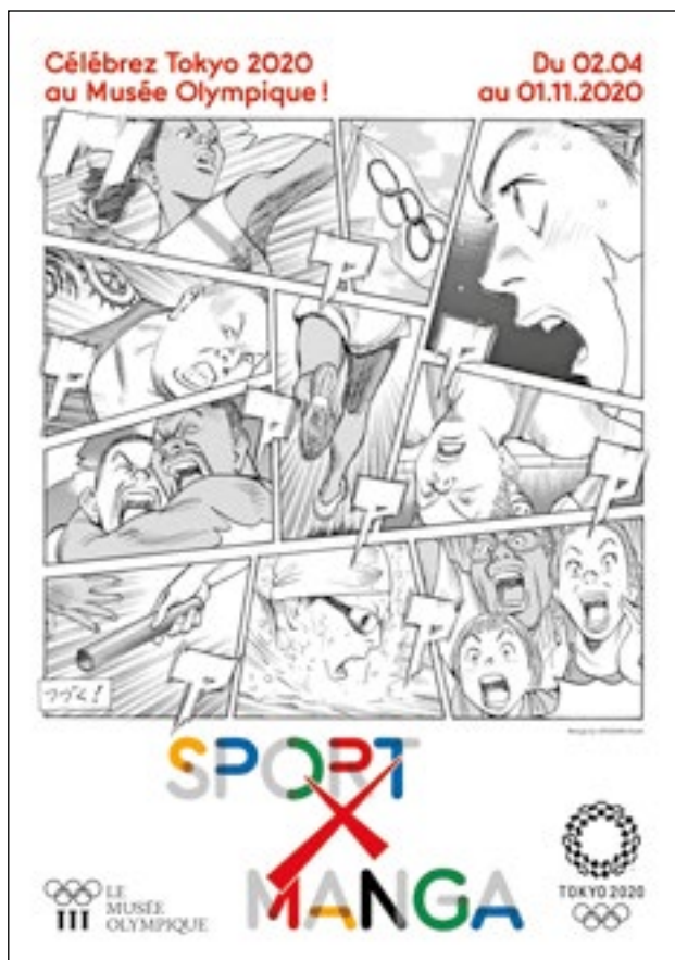
Sportmangas spielen in Japan eine wichtige Rolle; Anlässlich der Olympischen Spiele in Tokio ist ihnen eine Ausstellung gewidmet.