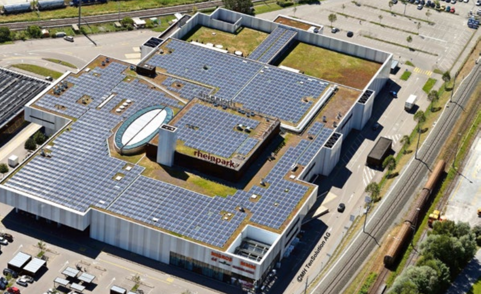
Der Rheinpark in St. Margrethen bringt es auf 918,32 kWp.

bessert werden kann. Führend in der Entwicklung von Solarzellen sind die USA und China. Mich interessiert dieses Thema ehrlich gesagt erst dann, wenn ein optimiertes Produkt auf dem Markt ist!