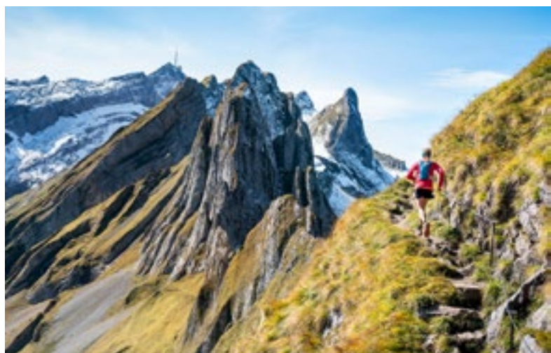
Mit Blick auf den Säntis: Der Alpstein-Trail führt von Wasserauen bis Seealpsee, über Mesmer und Meglisalp wieder nach Wasserauen.