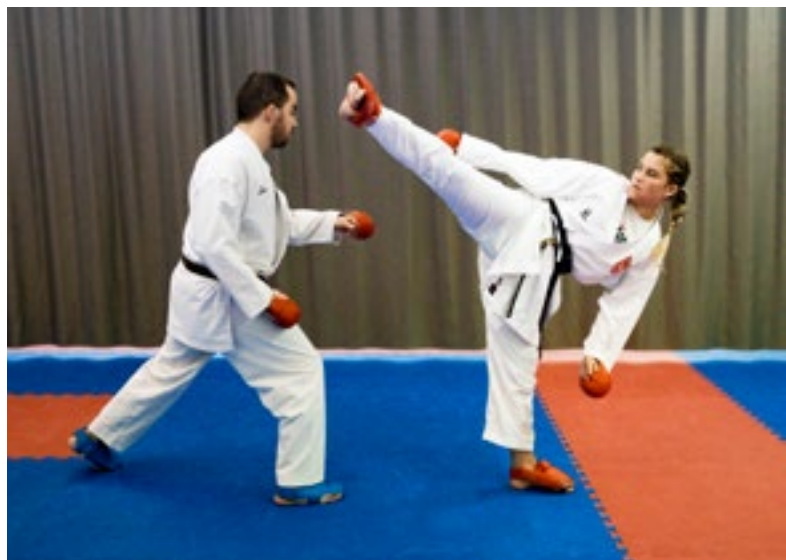
Das Karatetraining ist sportlich ausgerichtet, es werden aber auch Selbstverteidigungstechniken vermittelt.