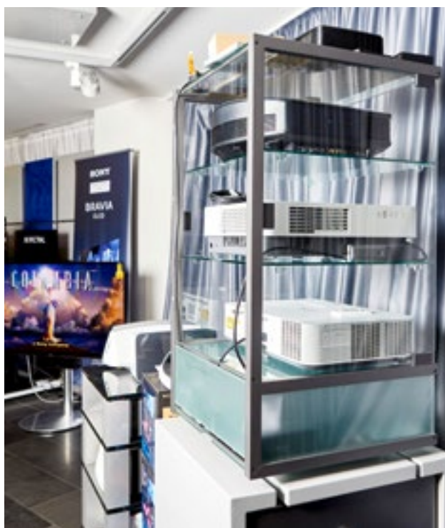
Die Wahl des richtigen Beamers ist entscheidend.