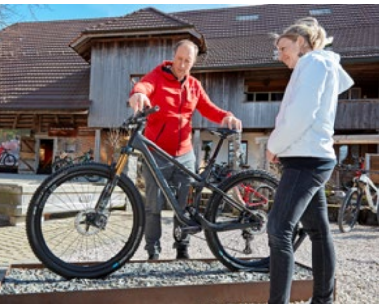
Die Olympia-«Geheimwaffe» Lightrider kann eins zu eins auch von den Endkunden erworben werden.

«Wir sind wohl eine der wenigen Marken, die das Top-Modell der Weltcup-Fahrer eins zu eins den Endkunden anbieten», hält Binggeli fest.