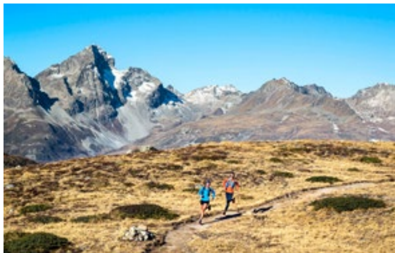
Mitten im Steinbockparadies: Der Trail rund um den Piz Languard im Engadin.